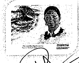
DIP. ELISA ZEPEDA LAGUNAS. INTEGRANTE

LAS PRESENTES FIRMAS CORRESPONDEN AL DICTAMEN EMITIDO POR LOS DIPUTADOS INTEGRANTES DE LA COMISIÓN PERMANENTE DE GOBERNACIÓN Y ASUNTOS AGRARIOS DE LA SEXAGÉSIMA CUARTA LEGISLATURA CONSTITUCIONAL DEL ESTADO, DENTRO DEL EXPEDIENTE NÚMERO CPGA/292/2019, DEL ÍNDICE DE ESTA COMISIÓN.