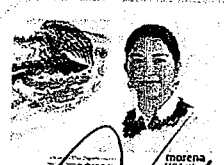
DIP. ELISA ZEPEDA LAGUNAS. INTEGRANTE

LAS PRESENTES FIRMAS CORRESPONDEN AL DICTAMEN EMITIDO POR LOS DIPUTADOS INTEGRANTES DE LA COMISIÓN PERMANENTE DE GOBERNACIÓN Y ASUNTOS AGRARIOS DE LA SEXAGÉSIMA CUARTA LEGISLATURA DEL HONORABLE CONGRESO DEL ESTADO LIBRE Y SOBERANO DE OAXACA, DENTRO DEL EXPEDIENTE NÚMERO CPGA/766/2021.